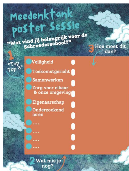
poster leerlingen "Meedenktank"

Met de eerste resultaten van de sessies met de bovenbouwleerlingen zijn de leerlingen van de "Meedenktank" aan de slag gegaan om ook hun gedachten neer te zetten en na te denken over een praktische uitvoering van de kernwaarden. De resultaten zijn teruggekoppeld met daarbij vervolgvragen aan de ouders/verzorgers met een vervolg brainstorm poster en een online enquête.