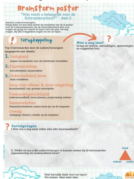
Brainstorm poster 2- ouders