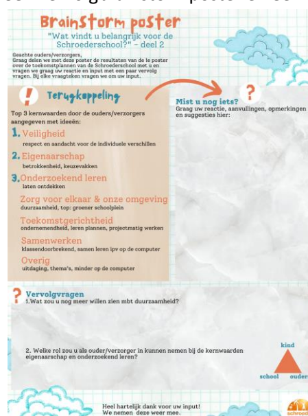
poster 2 ouders/verzorgers