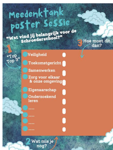
poster leerlingen Meedenktank

Met de eerste resultaten van de sessies met de bovenbouwleerlingen zijn de leerlingen van de 'Meedenktank' aan de slag gegaan om ook hun gedachten neer te zetten en na te denken over een praktische uitvoering van de kernwaarden. De resultaten zijn teruggekoppeld met daarbij vervolgvragen aan de ouders/verzorgers met een vervolgbrainstormposter en een online enquête.